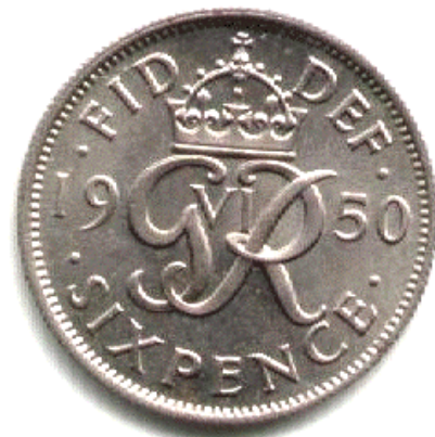
Een Sixpence (zes pennies) uit 1950

Heb je bij c dezelfde werkwijze gebruikt als bij b?