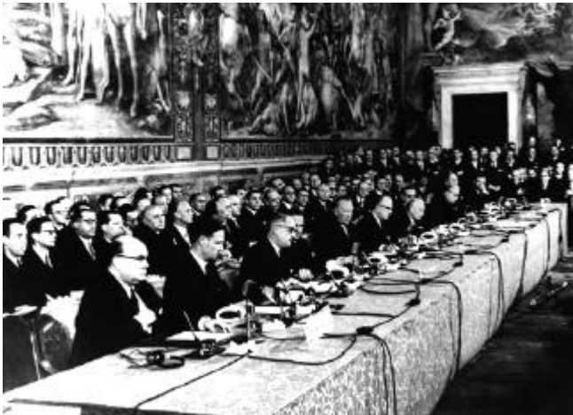
Ondertekening van het EEG-verdrag

Om iets aan de belemmeringen van de handel aan de grens te doen, richtten zes landen in 1957 de Europese Economische Gemeenschap of EEG op. Dat waren België, Duitsland, Frankrijk, Italië, Luxemburg en Nederland. Bij de handel tussen deze landen werden invoerrechten verlaagd en werden andere belemmeringen kleiner gemaakt of afgeschaft.