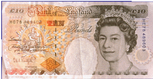
Biljet van 10 pond

De muntsoort de euro heeft twee eenheden: euro en cent. Ook het Britse muntsoort het pond heeft er twee, pond en penny. Bovendien is één pond gelijk aan 100 pence (meervoud van penny).