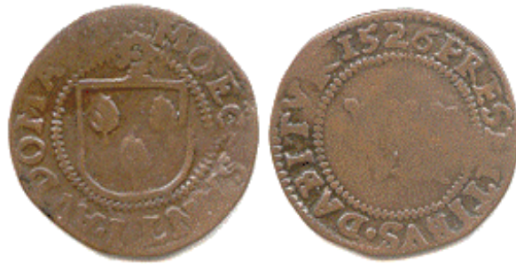
Een duit uit 1526

Zo is het niet altijd geweest. Toen Nederland geen koninkrijk was maar een republiek, was er een muntsoort met guldens, stuivers en duiten. Daarnaast waren er nog andere munten in omloop, de daalder (1½ gulden) bijvoorbeeld). De belangrijkste eenheden waren de gulden, de stuiver en de duit. Een gulden was 20 stuiver waard en een stuiver 8 duiten. Rekenen in deze muntsoort was moeilijker dan in euro's.